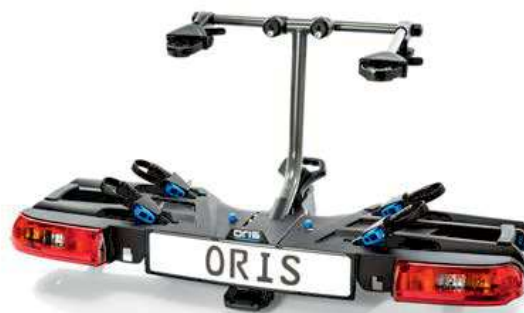
ORIS TRACC FIX4BIKE